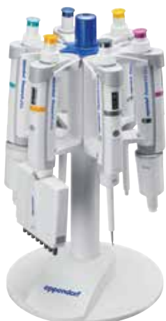
ピペットスタンド6本架 (リサーチプラス用)