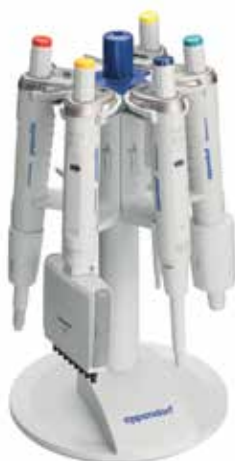
ピペットスタンド6本架 (Reference2用)

回転式の6本架けのピペットスタンドは、リサーチプラス、リファレンス2を実験台で保管するのに最適です。