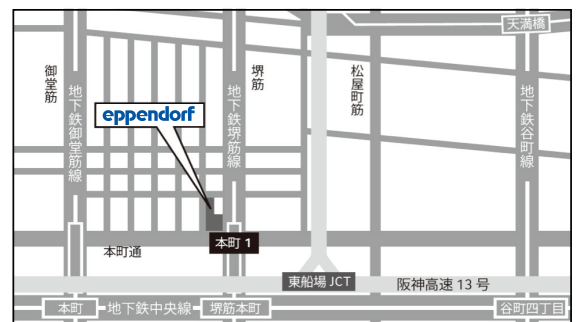
大阪会場 周辺地図

地下鉄堺筋線・中央線「堺筋本町駅」17番出口すぐ、地下鉄御堂筋線「本町駅」7番, 3番出口徒歩7分。14階にお越しください。