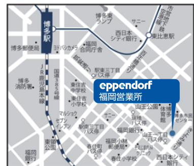
福岡会場 周辺地図

福岡市営地下鉄空港線「東比恵」駅1番出口より徒歩15分 西鉄バス「山王一丁目」停留所より徒歩3分