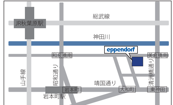
東京会場 周辺地図

JR秋葉原駅昭和通り口より徒歩8分 都営地下鉄岩本町駅A4出口より徒歩6分。1階が郵便局のビルです。2階にお越しください。